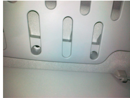
Tornillos de Parasoles