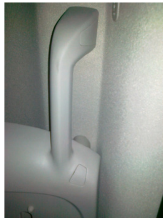
Tornillos de Agarraderos