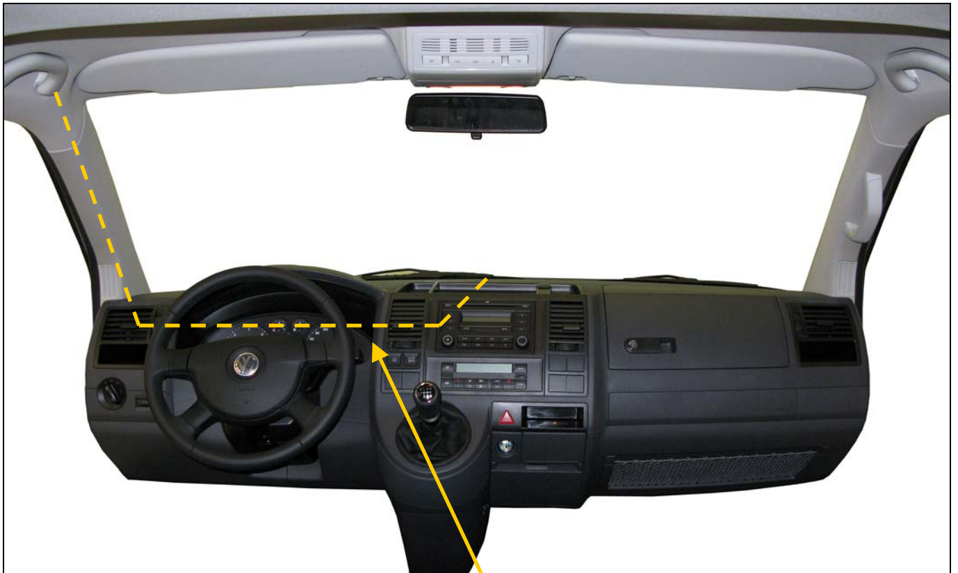
Recorrido de la manguera para el modulo tarifario

¡OJO!: EN CASO DE DISPONER DE AIRBAG DE CABEZA (o CORTINA) NO PASAR NUNCA UN CABLE POR LA PARTE FRONTAL DE LA BOLSA DE AIRBAG.