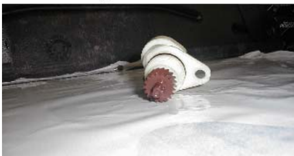
Piñón del captador de velocidad