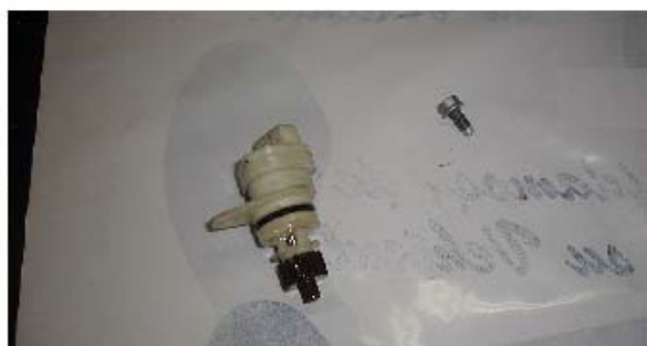
Captador de velocidad y tornillo sujeción