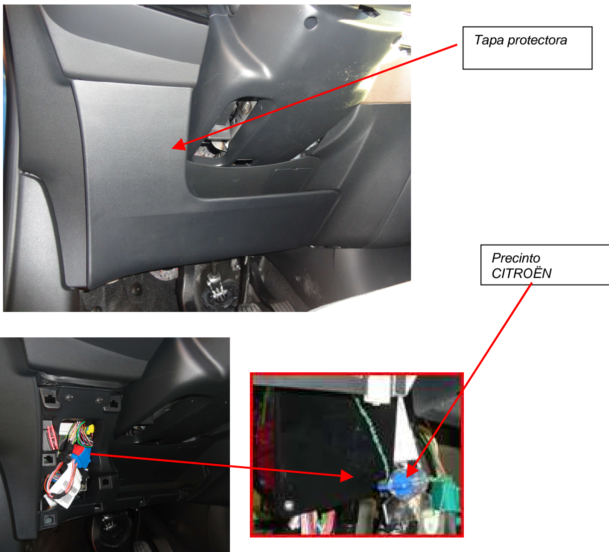
Fig. 1.1. Vista identificativa de la situación del precinto.

Se precintará la caja en cuyo interior va ubicado el conector IC01B. Éste se sitúa en la parte inferior izquierda del panel frontal. Se deberá extraer la tapa protectora.